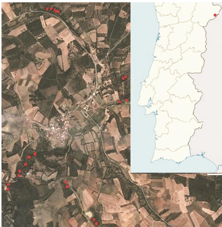
Fig. 1. Localização dos lameiros amostrados.

tação nas partes mais afetadas pela sombra dos freixos e olmos, assim como própria das sebes.