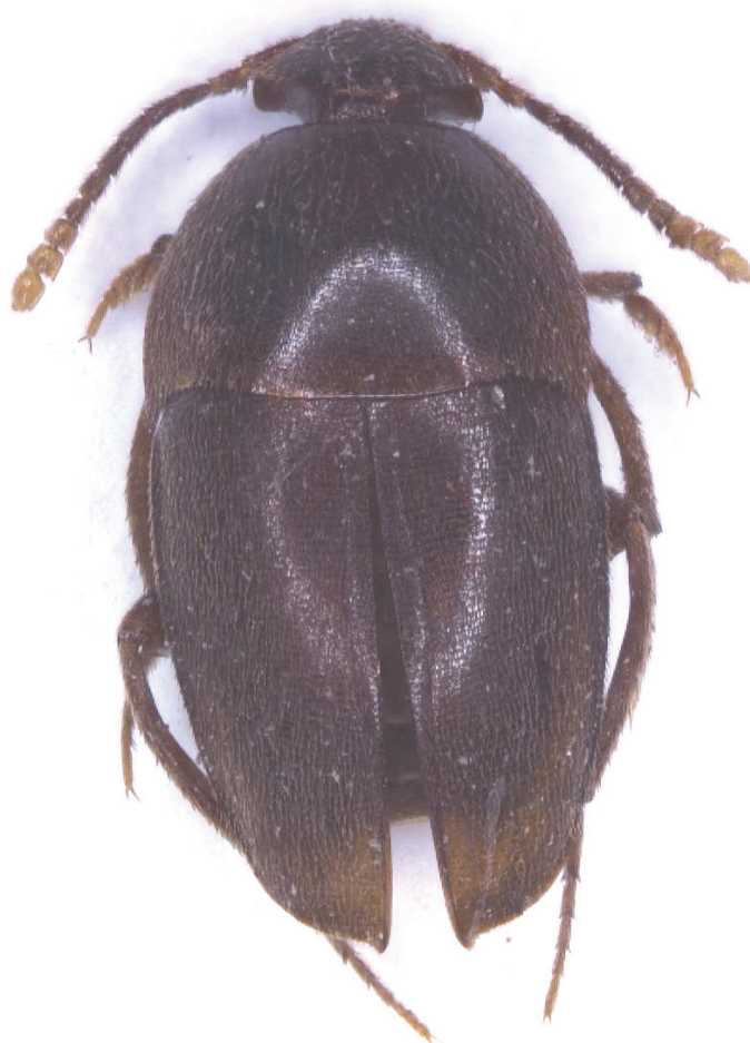
► Fig. 1. Adelopsis vulcania n. sp. Foto del hábitus, holotipo. // Fig. 1. Adelopsis vulcania n. sp. Habitus photo, holotypus.

DISTRIBUCIÓN. Hasta el presente todas las citas de esta especie corresponden a dos «Reservas Naturales» próximas, la de Otonga (provincia de Cotopaxi) y la de Otongachi (provincia de Pichincha) (Salgado, 2002, 2005a, 2008a, 2013a).